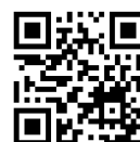
Jga-web QR コード